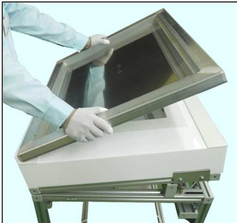
〈メタルマスクをセット〉