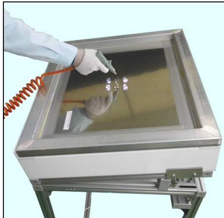
〈エアブロー&バキューム〉